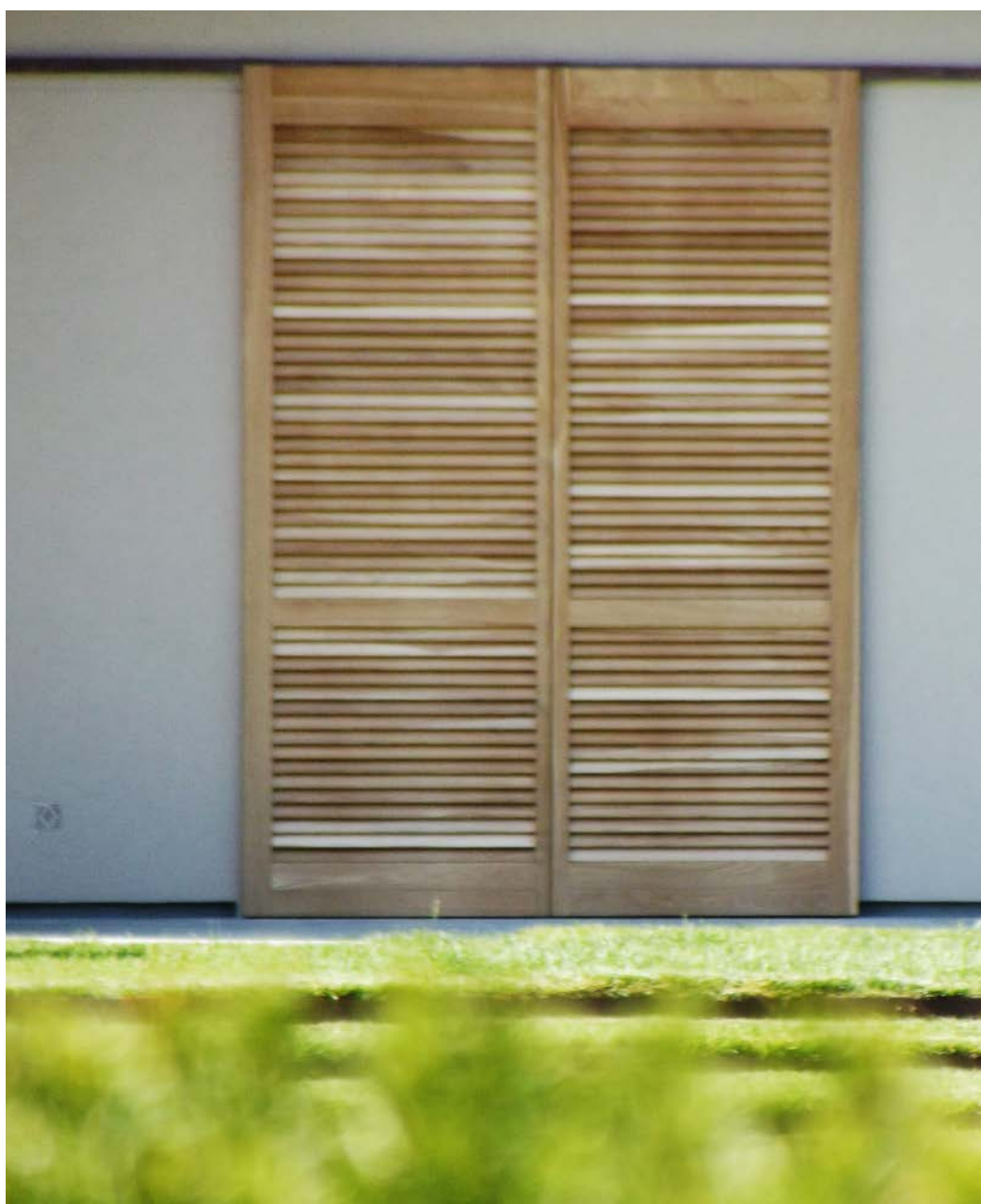
Mod. Persiana stecca chiusa tinta T27 Rovere