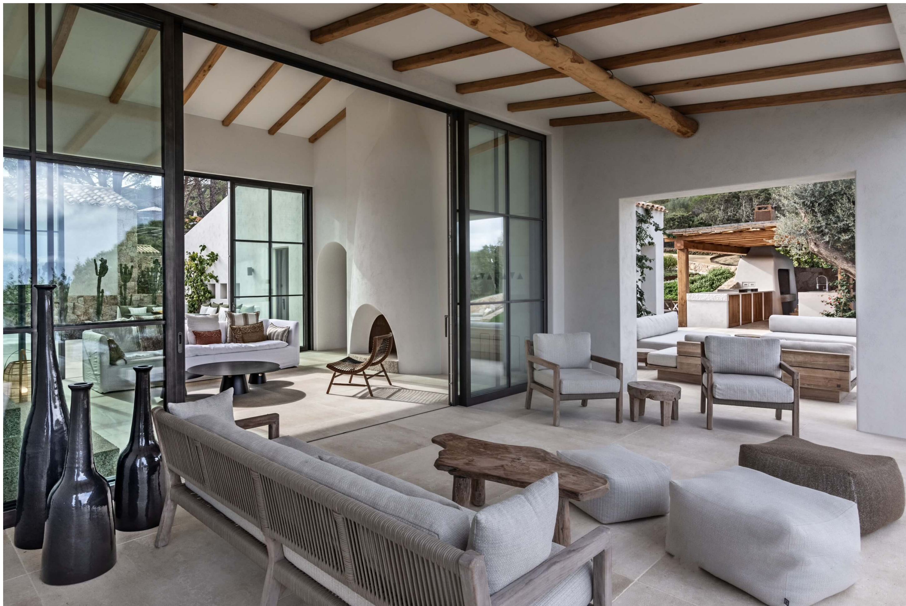
Mod. Acciaio zincato EBE 85 AS e OS2 75 col. peltro satinato