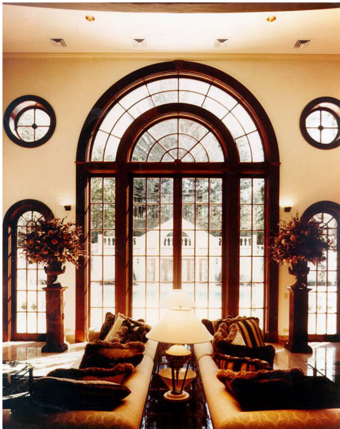
Mod. 68 Open-Out in mogano sapelli tinto palissandro