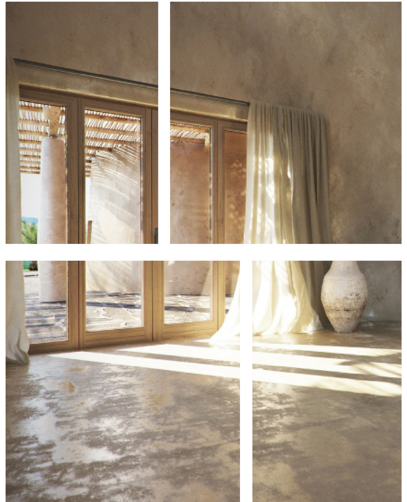
Mod. Extralusso in meranti laccato Scaffold Grey 5-Gloss (tinta personalizzata)

Nello specifico, i prodotti vernicianti utilizzati da Vertaglia Infissi rientrano nella categoria “vernici ed impregnanti per legno per finiture interne/esterne” e rispettano il limite di legge di COV (75 g/l). Inoltre, secondo quanto stabilito dalla stessa Direttiva, non contengono le sostanze pericolose, metalli pesanti, specifici composti organici e non superano il contenuto massimo di formaldeide libera di 10 ppm stabilito per legge.